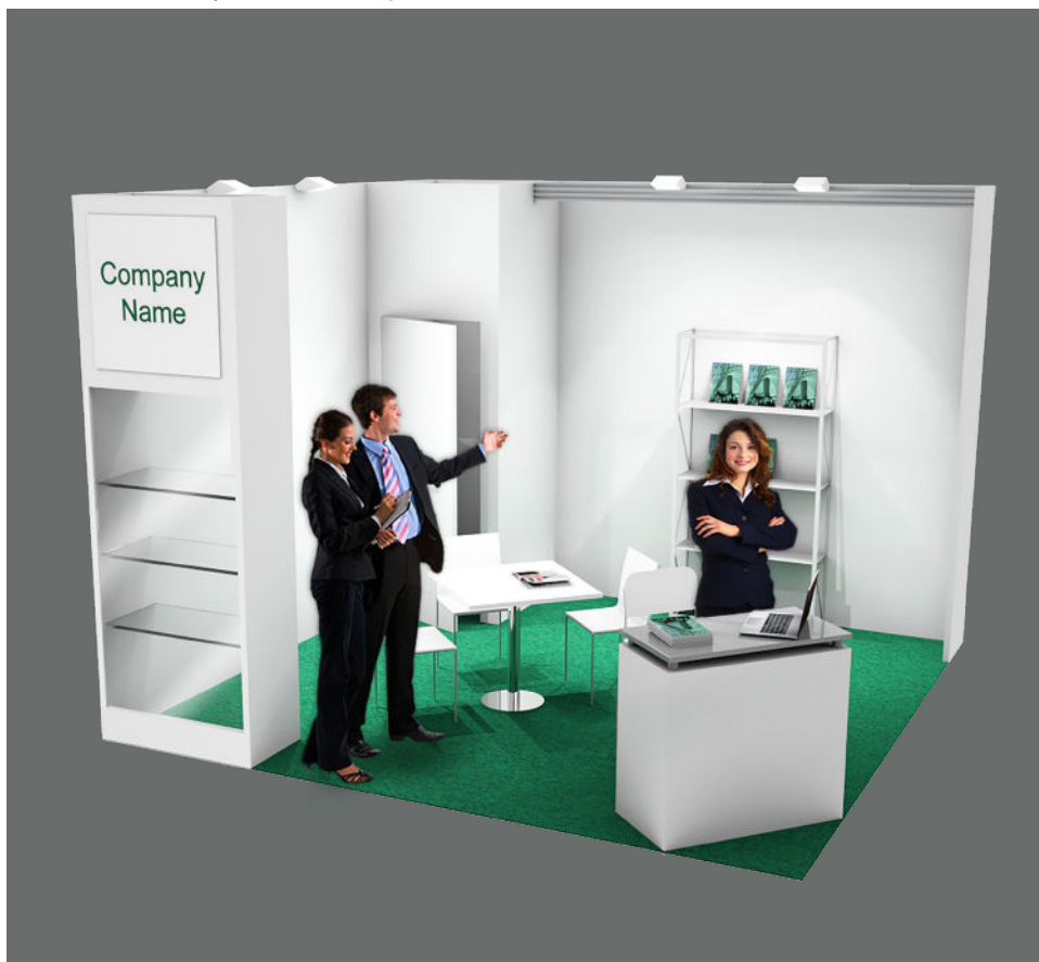
Soluzione 2 lati aperti / Two open sides booth